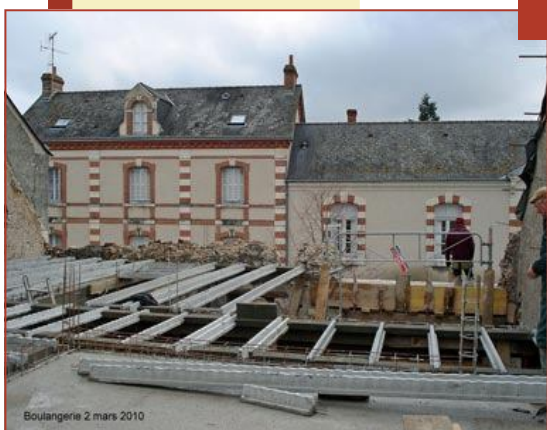
Boulangerie 2 mars 2010

L'ouverture de la boulangerie est prévue pour la saison touristique. C'est une course contre la montre, une course d'obstacles également, en particulier en matière d'intempéries : le gel des deux derniers mois a paralysé les travaux de maçonnerie.