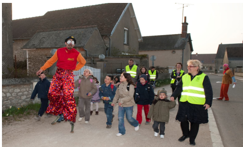
Des animations surprises (comme les clowns en 2009) seront au rendez-vous le temps du trajet pendant la semaine nationale du développement durable en avril 2010.

Le 18 janvier dernier, l'Agglo. a été récompensée par la fondation Norauto en recevant le 5ème prix « d'Eco mobilité » pour la création de ses lignes Carapattes. Appelés dans d'autres lieux autobus pédestre ou pédibus, c'est un système de ramassage scolaire qui se fait à pied et encadré par des adultes volontaires (le plus souvent des parents d'élèves). Il fonctionne comme une ligne de bus classique, avec des lignes, des arrêts, un terminus mais pas de moteur.