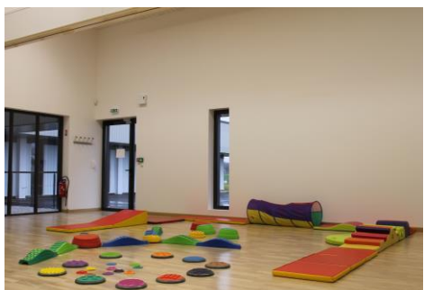
Salle de Chitenay