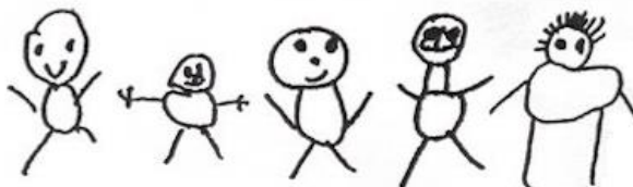
Dessins enfants TV plus de 3 h par jour © Peter Winterstein : Macht Fernseh dumm?

Voici les dessins d'enfants qui regardent la TV plus de 3h par jour: