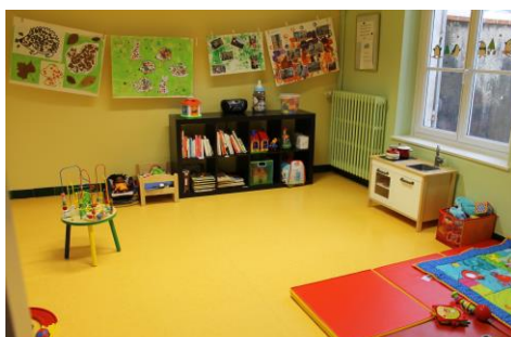
Salle du Ram de Cour-Cheverny