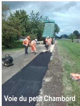
Voie du petit Chambord

Voie du petit Chambord : réfection partielle des bas-côtés réalisés par l'entreprise Colas coût : 5 820 €