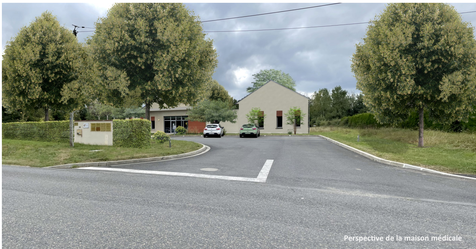
Perspective de la maison médicale

Bulletin municipal : octobre-novembre-décembre 2022